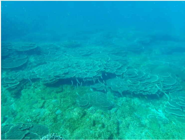
【図3】現在の串本町沿岸に生息するクシハダミドリイシ群集。