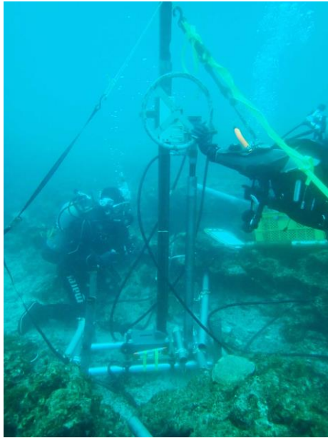
【図1】和歌山県串本町潮岬沖での水中掘削調査の様子。

には昔も今もサンゴ礁が形成された証拠はありません[8]。今回の掘削試料の解析でも、約7300年前から約3700年前まではサンゴの積み重なりが確認されましたが、約3700年前頃に何らかの海洋環境の変化によって、サンゴが積み重なることを止めてしまったことが明らかとなりました。