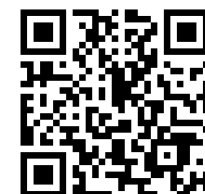
会場へのアクセス