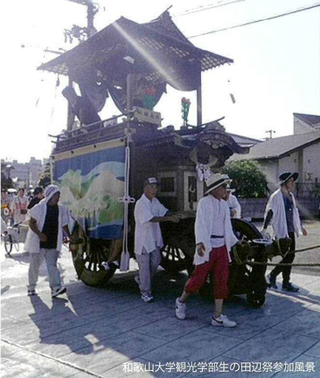
和歌山大学観光学部生の田辺祭参加風景

SOSMとLocal Wikiを活用した、地域資源の発掘と情報発信によるリーダー育成事業