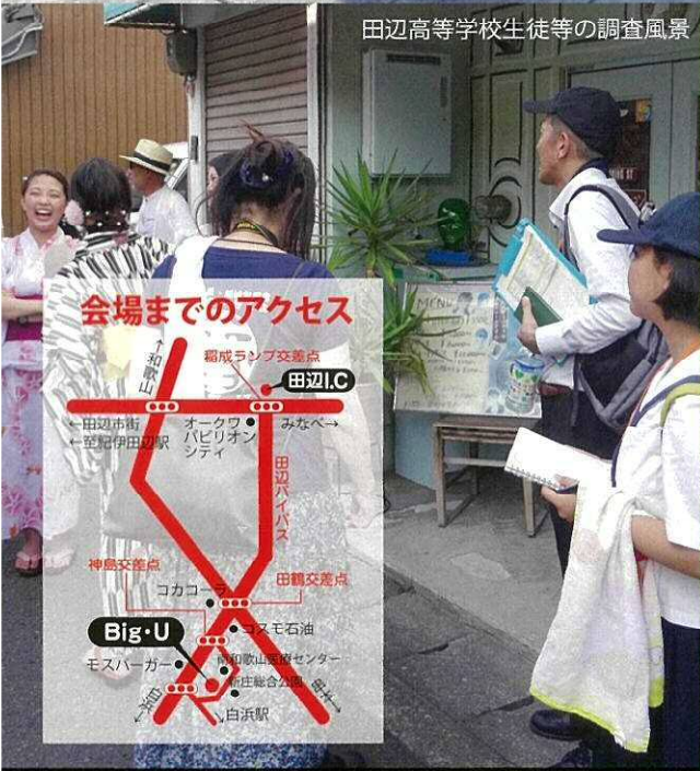
田辺高等学校生徒等の調査風景