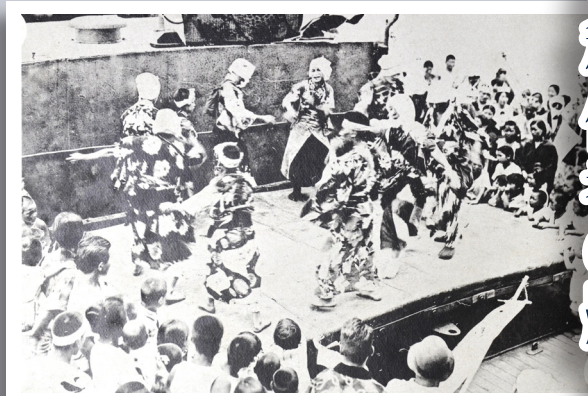
赤道祭の余興 手踊り