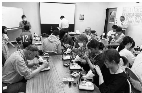
機材を使った実習の様子