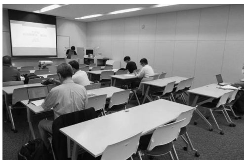
大学院科目の様子