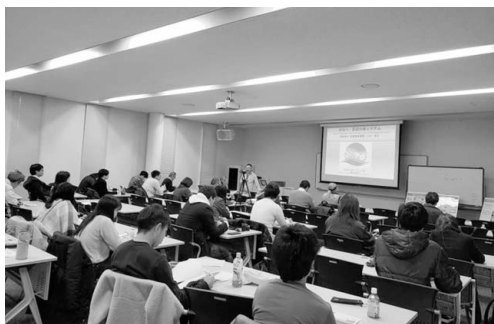
学部開放科目の様子