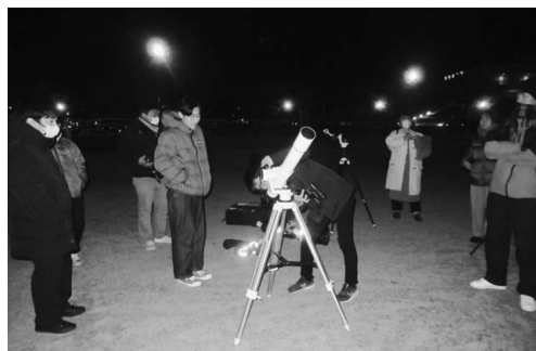
「南紀熊野の宇宙」現地実習の様子