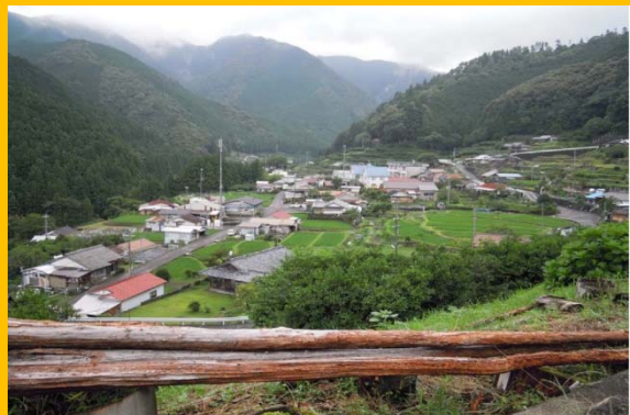
古座川町「平井の里」(2013.7.5撮影)