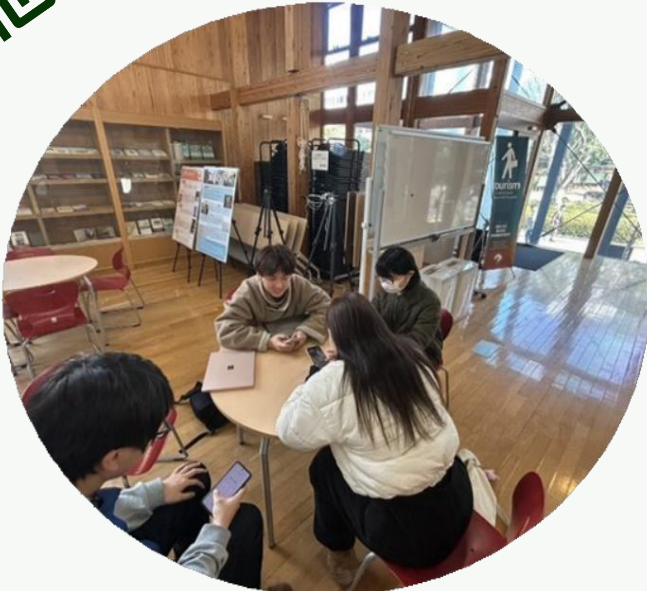
(ミーティングの様子)