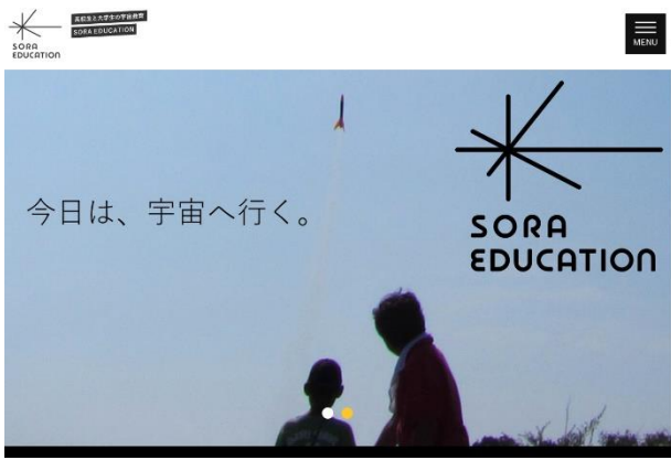
図 7 sora education ホームページ