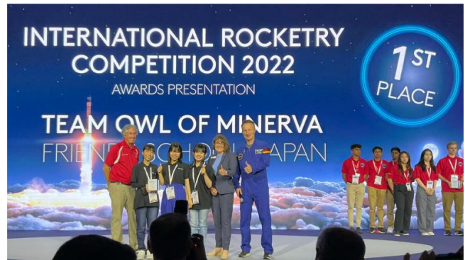
図4 日本チーム IRCにて初優勝