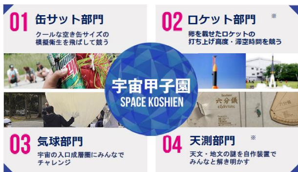
図2 宇宙甲子園の活動内容

高校生に対する宇宙甲子園は、2021年度より三菱みらい育成財団の御支援を受けることが出来、「缶サット部門」「ロケット部門」「気球部門」「天測部門」の4つに分類し(図2)、山崎直子宇宙飛行士が会長を務め、本学が事務局を務める「理数が楽しくなる教育」実行委員会として、全国で地方活動を支援する団体作りを実施した。これにより、宇宙甲子園には500名以上、関連するイベント・講演会には10,000