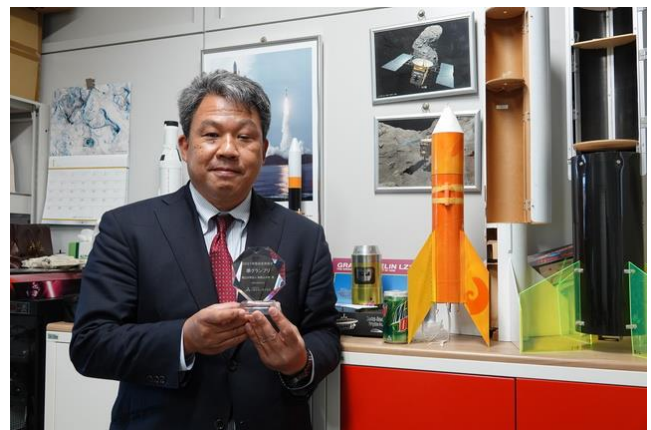
図5 三菱みらい育成財団 準グランプリ受賞

以上の参加を得ることが出来た。また全国的にも支援団体を増加させることが出来た(図3)