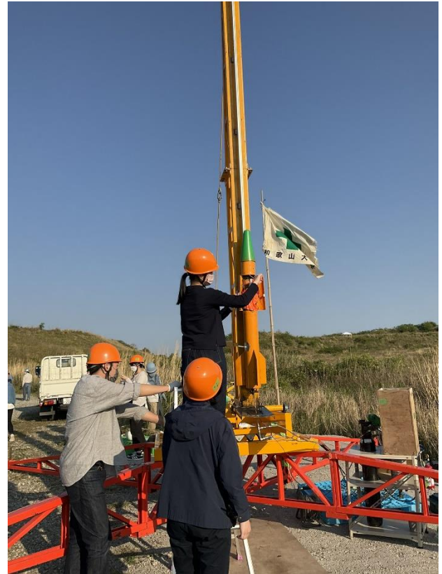
図 8 ロケットガール養成講座 打上

宇宙教育手法に関する教育実験として、本学では長年にわたり信愛女子高校と協力し、「ロケットガール養成講座」を開講している。2021 年度開講講座の打上実験、および 2022 年度開講講座を今年度は実施した (図 8)。