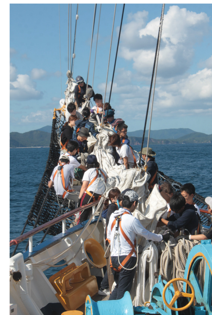
ルーズガスケット