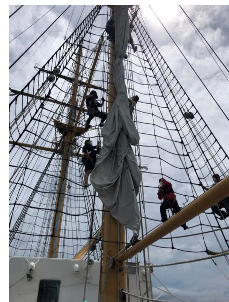
タイザガスケット