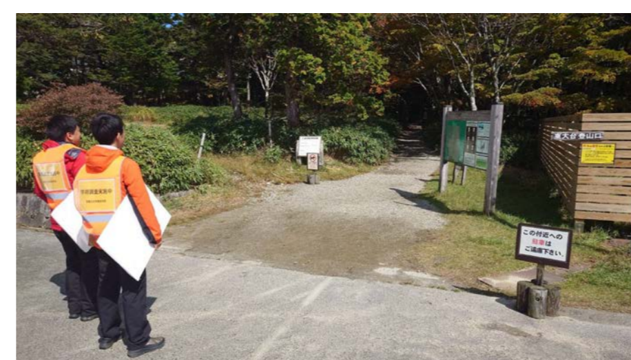
大台ヶ原での登山者アンケート調査 (奈良県/吉野熊野国立公園)