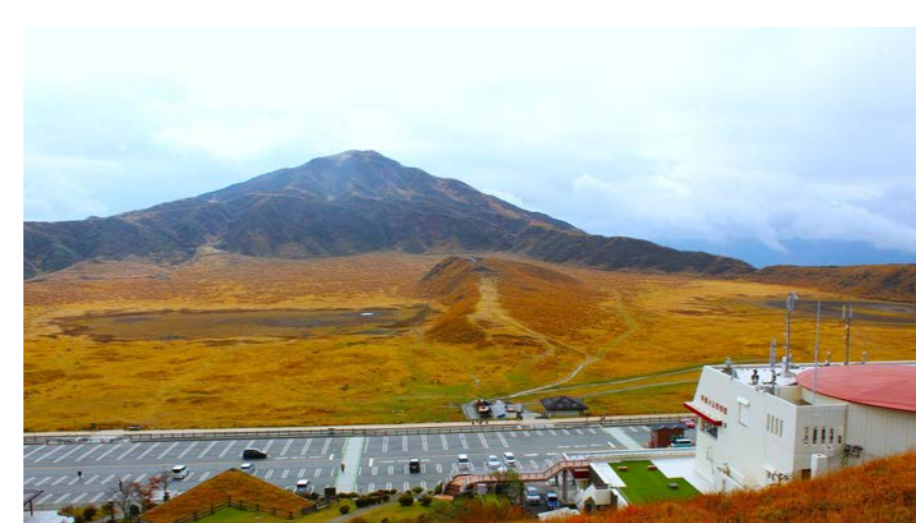
紅葉期の阿蘇・草千里 (熊本県/阿蘇くじゅう国立公園)