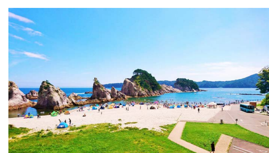
海水浴客で賑わう浄土ヶ浜 (岩手県/三陸復興国立公園)