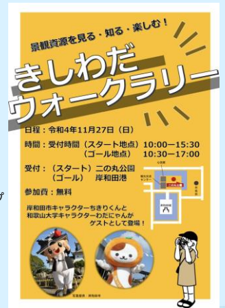
↑イベントポスター