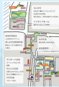
↑イベントで使用したマップ

当日は、天気にもめぐまれ、40人を超える幅広い世代の方々に参加して頂きました。大阪府が取り組んでいる景観資源のフォトイベントを併せてPRするなど岸和田市の景観資源の魅力の発信に貢献できました。また、スタート地点とゴール地点に設置した着ぐるみの集客効果は予想以上に高く、イベントに興味を持ってもらうためのきっかけを作る役割を果たしました。参加者の方から「知らなかった美しい景観資源を知ることが出来た」等の意見を頂くなど、参加者の満足度が高い結果になりました。