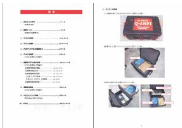
図2：プロトタイプマニュアルの抜粋

本研究では、実験に用いた試作マニュアルの内容に、今回の実験結果から入手できた内容を加えてプロトタイプのマニュアルを作成し、内閣府に示した。