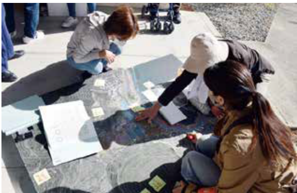
写真3 模型をもとに地域の知恵を「見える化」する

平田研究室では、この研究に先立つ、2017年度に全世帯悉皆アンケートを行っており、また2045年発災を想定した場合に、どの程度の居住世帯がいるか、集落外流出がどの程度発生するかを推測している。この推測を元に自力再建数、災害公営住宅数を算出し、浸水域外に必要な住宅用地面積を計算した。次に、2020年11月の地区避難訓練にて、住宅再建用地にふさわしい場所に関して、集まった住民に意見を聞いた（写真3）。特に「高台」では、土砂災害のリスクに加え、台風時の強風、植生、土地履歴や利権などの要素が関係してくる。さらに浸水域で居住