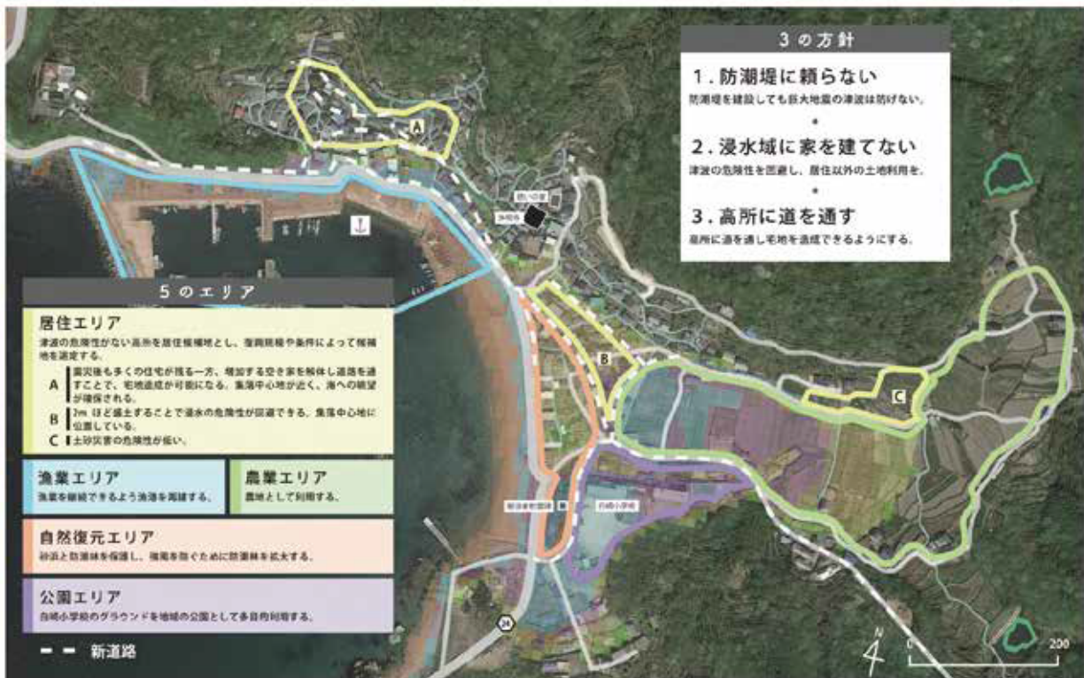
図3 大引集落の事前復興計画案の5つのゾーニング