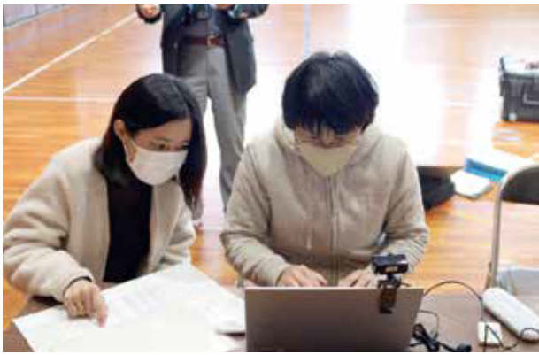
写真2 個人情報入力状況 (貴志南小学校体育館)