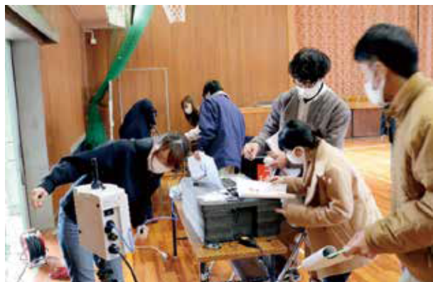
写真1 実験状況（貴志南小学校体育館）

はじめこそ、学生チームが早かったが、途中でつまづくと問題点が解決せず、作業はそのまま進まなくなってしまった。