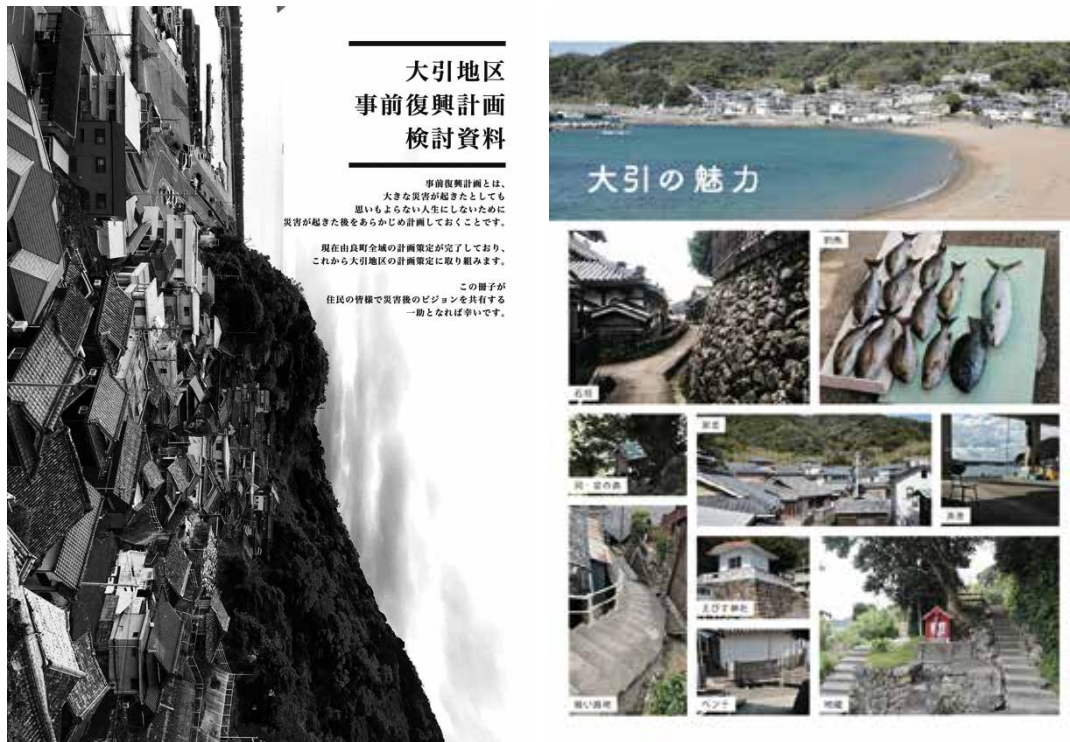
図4 大引集落・事前復興計画検討用パンフレット（一部） 作成：池内天子（和歌山大学大学院/当時）