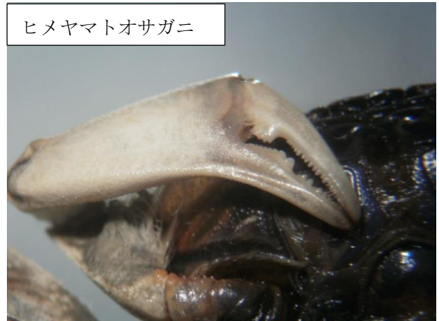
ヒメヤマトオサガニ