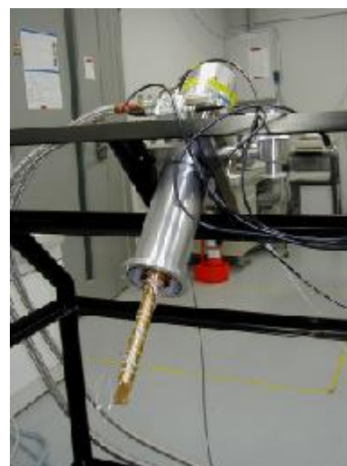
電気伝導度測定装置