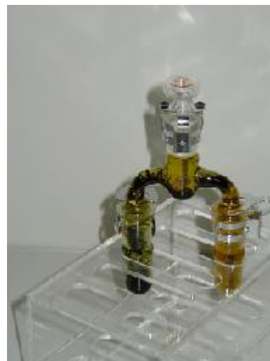
拡散法による結晶成長