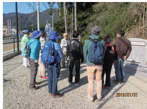
写真-5 紀伊半島大水害慰霊碑の前に土石流による被害についてガイドの説明に耳を傾ける参加者