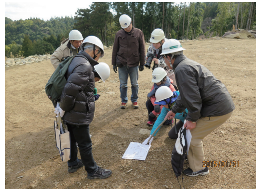
写真-4 金山谷で和歌山大学の研究成果をもとに紀伊半島における土砂災害の危険性について解説するガイド