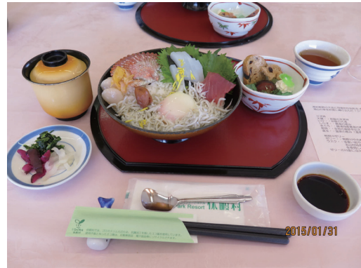
写真-3 休暇村南紀勝浦が提供するジオ井