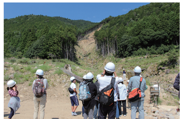
写真-1 金山谷でガイドから説明をうける参加者

昭和19年12月7日の東南海地震による津波被害を現在に伝える大津浪記念之碑を前に、昭和の南海・東南海地震による津波について考えた。