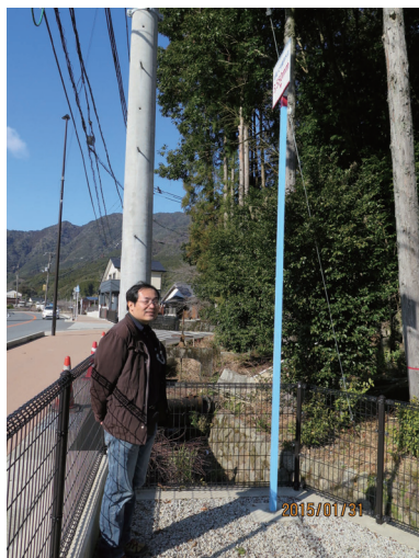
写真-6 氾濫水位を示す標柱とその高さに驚く参加者

また、時間の関係上昼食を食べてからの行程であったことから、途中で休憩する機会がなくなってしまった。トイレ休憩をはさむことで対応したが、当日の気候条件も悪かったこともあり、参加者への負担となっていた。ジオサイトでの見学が連続するのではなく、実際に体験できる場所や参加者が飲食できる機会をはさむなど、ツアー行程内でのメリハリも重要だということが再認識された。