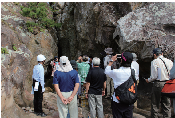
写真-2 鈴島でガイドから説明をうける参加者