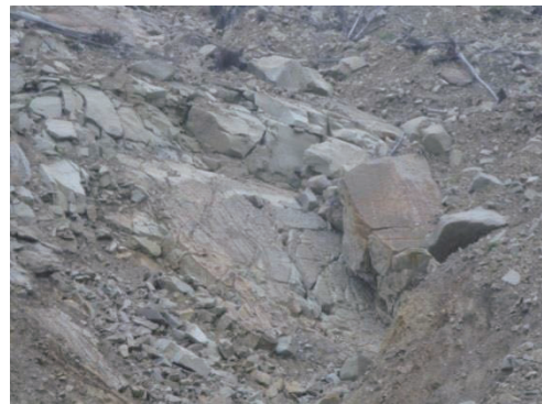
写真-3 節理の発達する層理面の流れ盤 (田辺市熊野. 2013年10月5日撮影)

田辺市熊野では、幅500m、高さ280mの大規模斜面崩壊が起こり、土砂ダムが形成されるとともに、土石流が下流の集落まで到達した。この崩壊地は、牟婁帯北部域の大規模な第1級の褶曲構造の向斜の北翼にあたり、地