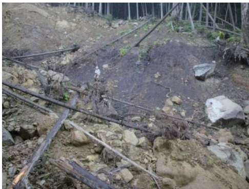
写真-4 遮水帯となった粘土質変質帯 (那智勝浦町口色川, 2012年10月27日撮影)