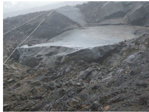
写真-2 砂岩泥岩互層に混在する砂岩ブロック (田辺市伏 菟野. 2013年7月3日撮影)

田辺市伏菟野の崩壊地は、泥岩優勢の砂岩泥岩互層が複雑な小褶曲をくり返すだけでなく小褶曲をなす部分がブロック化するとともに、そのなかに泥岩および砂岩のブロックが多数混在するという極めて複雑な地質構造をしている(写真-2)。このような構造は付加体の初生的な変形に加えて、近傍にあるスラストの運動に伴って形成されたとみられるが、さらにこのスラストはそれ自身が大きく屈曲しており、スラストの運動とその後の屈曲により、局所的な強度低下と地下水の高浸透域が形成され、これが崩壊の素因となったとみられる 21),22),23) 。