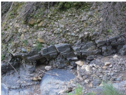
写真-5 節理面・層理面で緩んだ泥質互層 (新宮市九重, 2013年12月7日撮影)

(新宮市熊野川町, 新宮市高田), 新宮市佐野, 那智勝浦町色川, 古座川町小川上流域および三重県御浜町などで崩壊や土石流が発生したが, 付加体の大規模斜面崩壊や火成岩体の崩壊・土石流のような大規模な斜面災害はみられない。また熊野層群の崩壊頻度は低く, 熊野酸性火成岩体の崩壊頻度の10分の1程度と推定される。