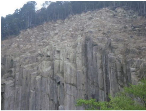
写真-6 花崗斑岩の風化帯（三重県紀宝町、2013年3月29日撮影）