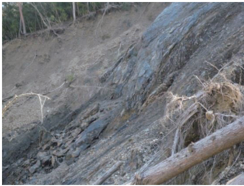
写真-1 スラストの破碎帯 (田辺市本宮町奥番. 2013年2月3日撮影)