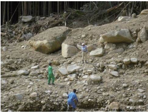
写真-7 流下した土石流堆積物（那智勝浦町金山、2011年10月2日撮影）

崩壊源頭部～土石流末端まで花崗斑岩のみが分布しており、土石流の流路には新鮮な花崗斑岩が露出したところが多く、土石流は急峻な斜面を短時間に流下したものとみられる 32) 。また三重県紀宝町では、83箇所の崩壊が確認されており、崩壊の発生箇所は南～南東向き斜面に8割が集中している 33) 。三重県の熊野酸性火成岩体では、花崗斑岩の北岩体で118箇所(0.41箇所/km 2 )、花崗斑岩の南岩体で117箇所(1.06箇所/km 2 )、流紋岩体で27箇所(0.44箇所/km 2 )の崩壊が確認されている 34) 。