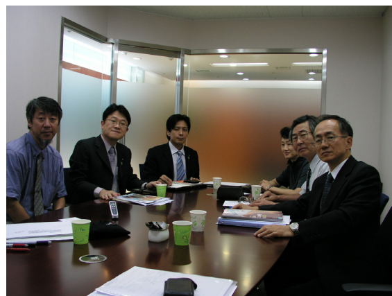
南都銀行上海代表處 06年9月15日