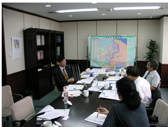
大阪國際商業振興協會上海代表處 06年9月15日