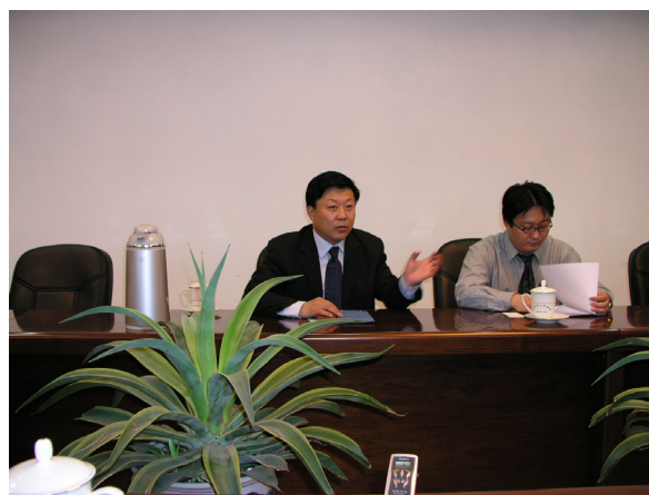
山東省人民政府 06年9月13日