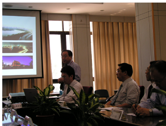
济南冠世時装 (グンゼ) 06年9月12日