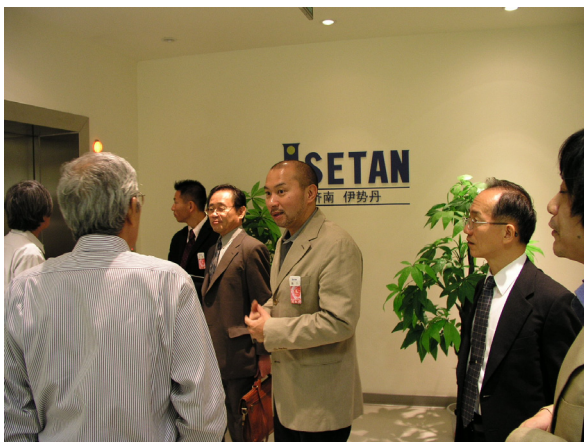
济南伊勢丹 06年9月12日