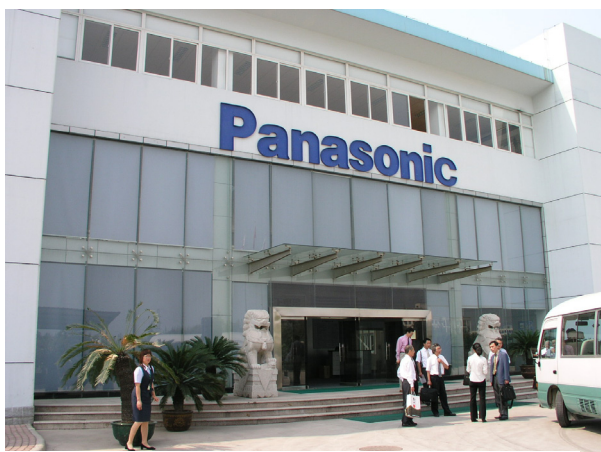
山東松下電子信息 06年9月13日